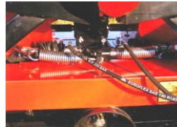
HYDRAULIC REMOTE CONTROL Accurate shutter open and close from tractor cab.

Filet robuste pour filtrer de possibles grumeaux dans l'engrais la trémie