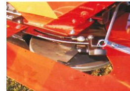
NYLON SHUTTERS Anti corrosion shutters on lower part of hopper.

TELECOMMANDE HYDRAULIQUE Obturbateur précis qui ouvre et ferme de la cabine du tracteur.