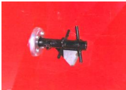
LOW SPEED AGITATOR (85 RPM) Uniform flow through 2 horizontal agitators

AGITATEUR BASSE VITESSE (85 RPM) Epandage uniforme par 2 agitateurs horizontaux