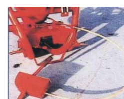
REMOTE CONTROL TÉLÉCOMMANDE