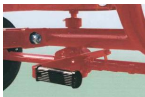
WHEEL DRIVE WITH RELEASE DEVICE ROUES MOTRICES AVEC DISPOSITIF DE DÉBRAYAGE