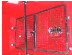
Strong net to filter possible fertilizer clots

AGITATEUR BASSE VITESSE (85 RPM) Epandage uniforme par 2 agitateurs horizontaux